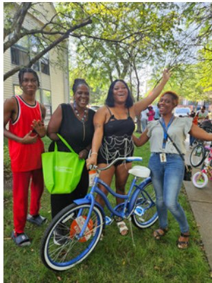
Rifa de bicicletas, juegos y tarjetas de regalo proporcionadas por los Centros de desarrollo