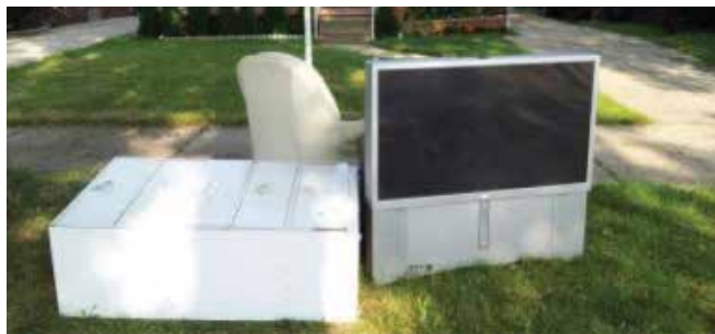
Días de recolección de residuos a granel en su vecindario.